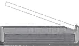
Vue de dessus