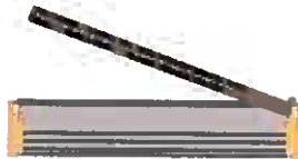
Vue de dessus